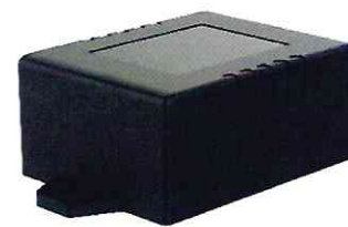
В) Устройство сбора и передачи данных RWCS-3903