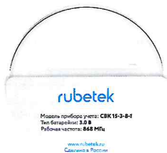
А) Устройство сбора и передачи данных RWCS-3915

Общий вид ПТК «Рубетек» представлен на рисунке 1.