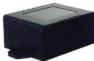
Б) Устройство сбора и передачи данных RWCS-3902